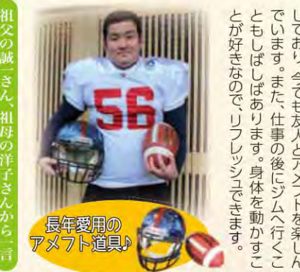
長年愛用のアメフト道具

編集後記 あけましておめでとうございます! 2020年、今年もオリンピックイヤー。様々な面で盛り上がる一年となりそうです。 昨年は千葉県内でも台風被害が多発した大変な年でしたが、2020年が皆さまにとってたくましく笑顔溢れる素敵な一年となりますよ。 ナホコ