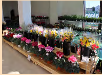
▲八千代市内生産者の新鮮農産物が毎日陳列されます♪