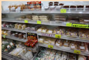
▲豆腐、油揚げ、がんもどき