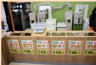
▲お米の量り売り、その場で精米