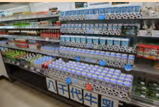
▲八千代牛乳他、乳製品・ジュース各種