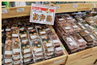
▲農家のお赤飯、おこわ、お惣菜