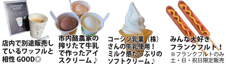
店内で別途販売しているワッフルと相性 GOOD◎