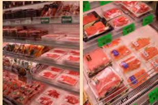
▲肉、ウインナー、ベーコン、魚