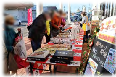
▲「よったいよ」では随時、様々なイベントを行っています。