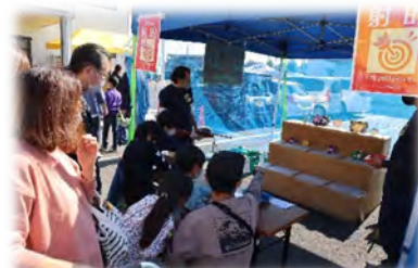
▲「トウモロコシ祭り」(上段)と「秋の収穫祭」(下段)の様子。