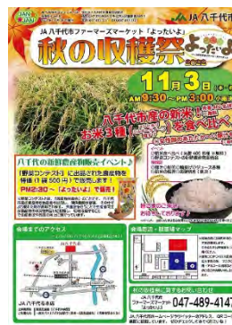
JAN 2 (じゃんじゃん)