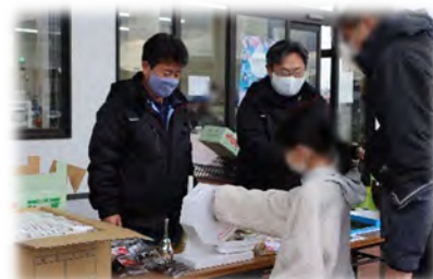
▲「よったいよ」1周年記念イベントの様子。