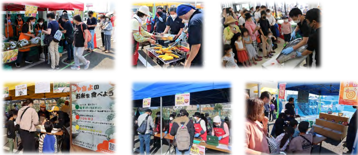
▲「トウモロコシ祭り」(上段)と「秋の収穫祭」(下段)の様子。