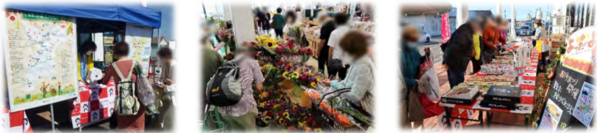
▲「よったいよ」では随時、様々なイベントを行っています。

さらに12月には「よったいよ」が1周年を迎えた記念に、先着200名への紅白餅の振り舞い・ガラポン・野菜の詰め放題などを行いました。