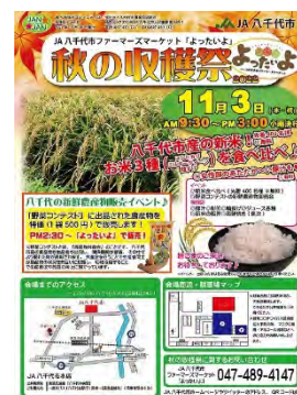
JAN 2 (じゃんじゃん)