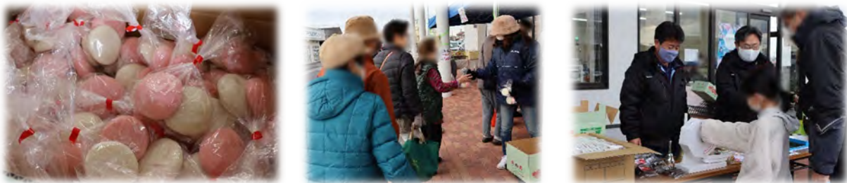
▲「よったいよ」1周年記念イベントの様子。