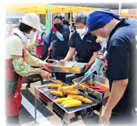
▲昨年は 3 年ぶりに夏・秋のお祭りを開催！大盛況でした。

ファーマーズマーケット「よったいよ」では、各種イベントを開催して地場農産物のアピールを行ったり、来店者がより魅力的に感じる店舗作りを心掛けています。たくさんの方にご利用頂くことで、地域の活性化と農業者の所得増大に繋がっています。