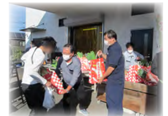
▲各種農産物の PR 販売や講習会の様子