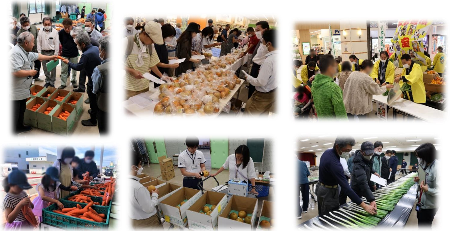
▲ニンジン・ネギ・梨などの各種共進会、販売PRイベントを開催しました。 ⇒共進会の様子。梨⇒イオンモール八千代緑が丘での即売会の様子

また、昨年も旬を迎えた梨やニンジンのPR即売会を行いました。さらに、八千代市園芸協会は共進会とイオン八千代緑が丘でPR即売会も行い、多くの消費者に旬の農産物をアピールすることができました。