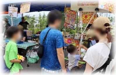
▲「トウモロコシ祭り」の様子。

様々な催し物を通じて、地元産農産物や農業への関心を高めてもらい、大々的に市内産農産物のアピールができました。また、多くの生産者と消費者の貴重な交流の機会となりました。