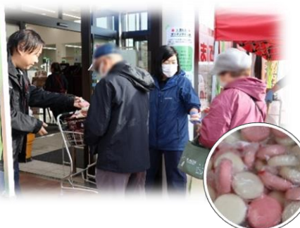
▲「よったいよ」2周年記念イベントの様子。