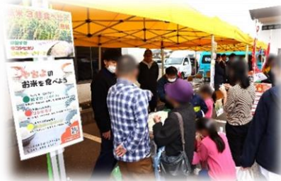
▲「秋の収穫祭」の様子。